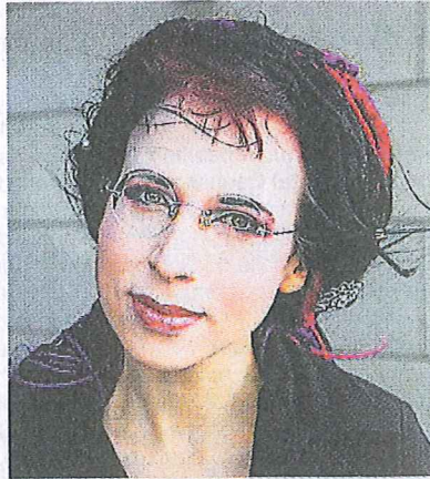
La romancière Sofi Oksanen sera à l'IMEC aujourd'hui, mais la soirée affiche complet.

Hommage à Qu'est-il arrivé à Baby Jane ? de Robert Aldrich, le roman de Sofi Oksanen explore la question